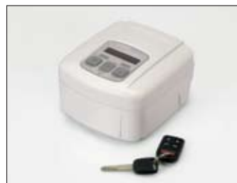
DeVilbiss CPAP aparato IntelliPAP Autoadjust aparatas